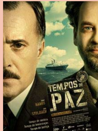
Poema retirado do filme "Tempos de Paz"

Em chegando a esta paixão um vulcão, um Etna feito, quisera arrancar do peito pedaços do coração. Que lei, justiça, ou razão, nega aos homens - ó céu grave! privilégio tão suave, exceção tão principal, que Deus a deu a um cristal, ao peixe, à fera, e a uma ave?"