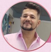
Cabeleireiro Plínio 71 8613-9662